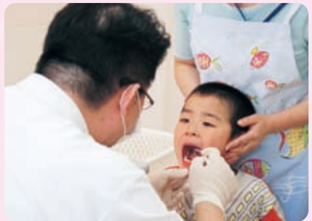
歯並びやかみ合わせなどを審査

歯の健康を保つには、予防に勝る治療はありません。皆さんも、むし歯や歯周病になる前に、日ごろから歯科検診を受けるなど予防を心掛けましょう。